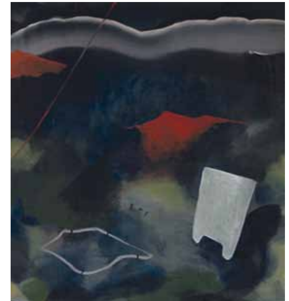
Caroline Günther, Golgotha , 2015, Öl und Lackspray auf Leinwand, 64 x 60 cm

Mit der Abstraktion, dem Gegenständlichen, dem Landschaftlichen und dem Lyrischen bzw. dem Filmischen wählten die Künstler für die Annäherung an das kanonische Thema der Kreuzigung sich ergänzende Darstellungsweisen, die in ihrer Vielfalt zugleich die gestalterische Bandbreite wie Ausdruckskraft der Kunst des 21. Jahrhunderts im sakralen Kontext erlebbar machen.