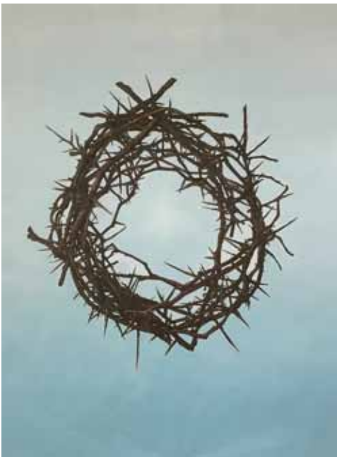
Michael Klippahn, Kranz , 2015, Öl auf Papier, 100 x 70 cm

Die Kreuzigung von Jesus Christus: Mit kaum einem Bildmotiv haben sich Künstler über alle Epochen hinweg intensiver auseinandergesetzt. Entsprechend des jeweiligen Zeitgeschmacks und auch abhängig von dogmatischen Veränderungen wurden dabei verschiedene Darstellungsmodi entwickelt, die den Kreuzestod jeweils aktualisiert in die Gegenwart überführten.