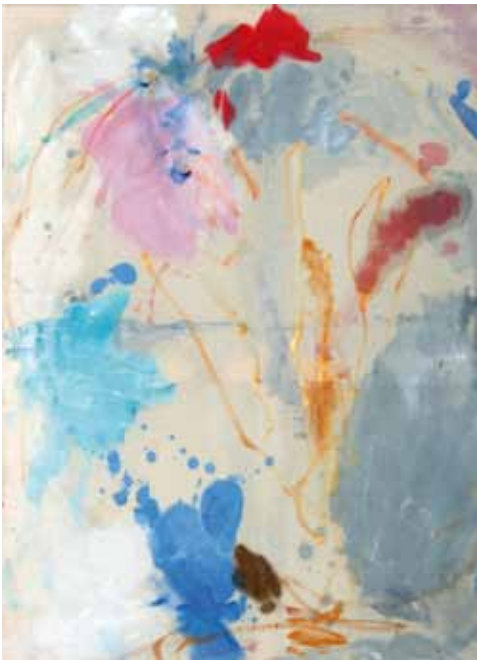
Winnie Seifert, Easter , 2015, Öl auf ungrundierter Leinwand, 125 x 90 cm